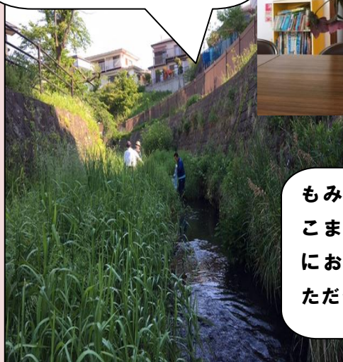
もみじ会の総会で こまくさ苑の花瓶 にお花を生けていただきました！